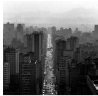
Avenida São João, 1986