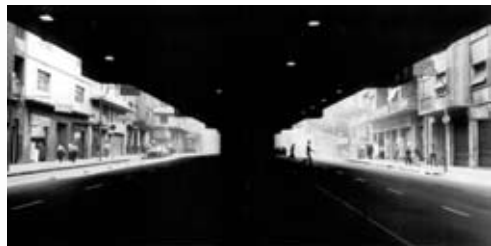
São Paulo, 1983